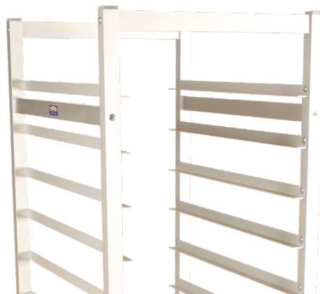
Enkel förvaring av kantiner